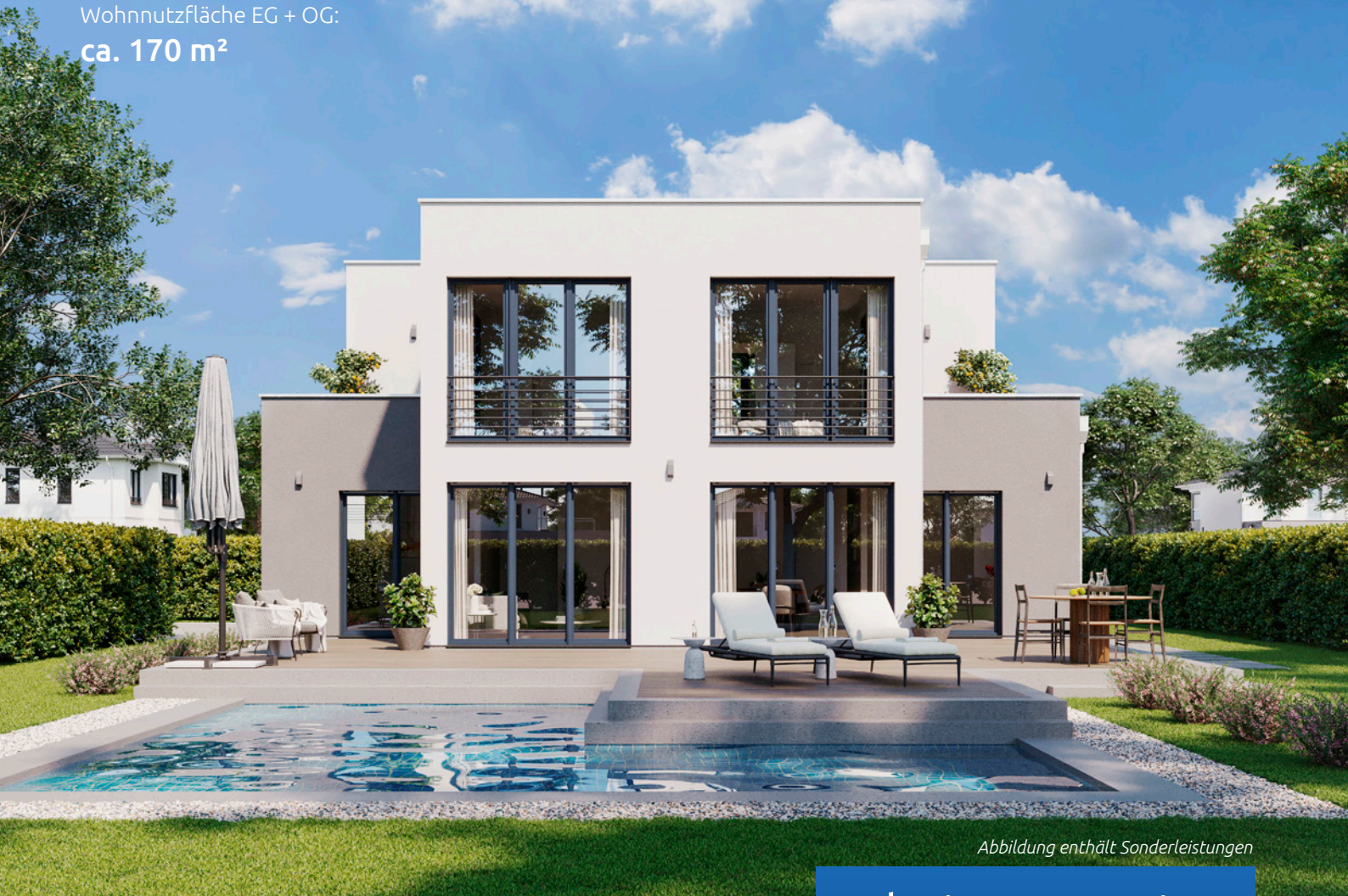
Abbildung enthält Sonderleistungen