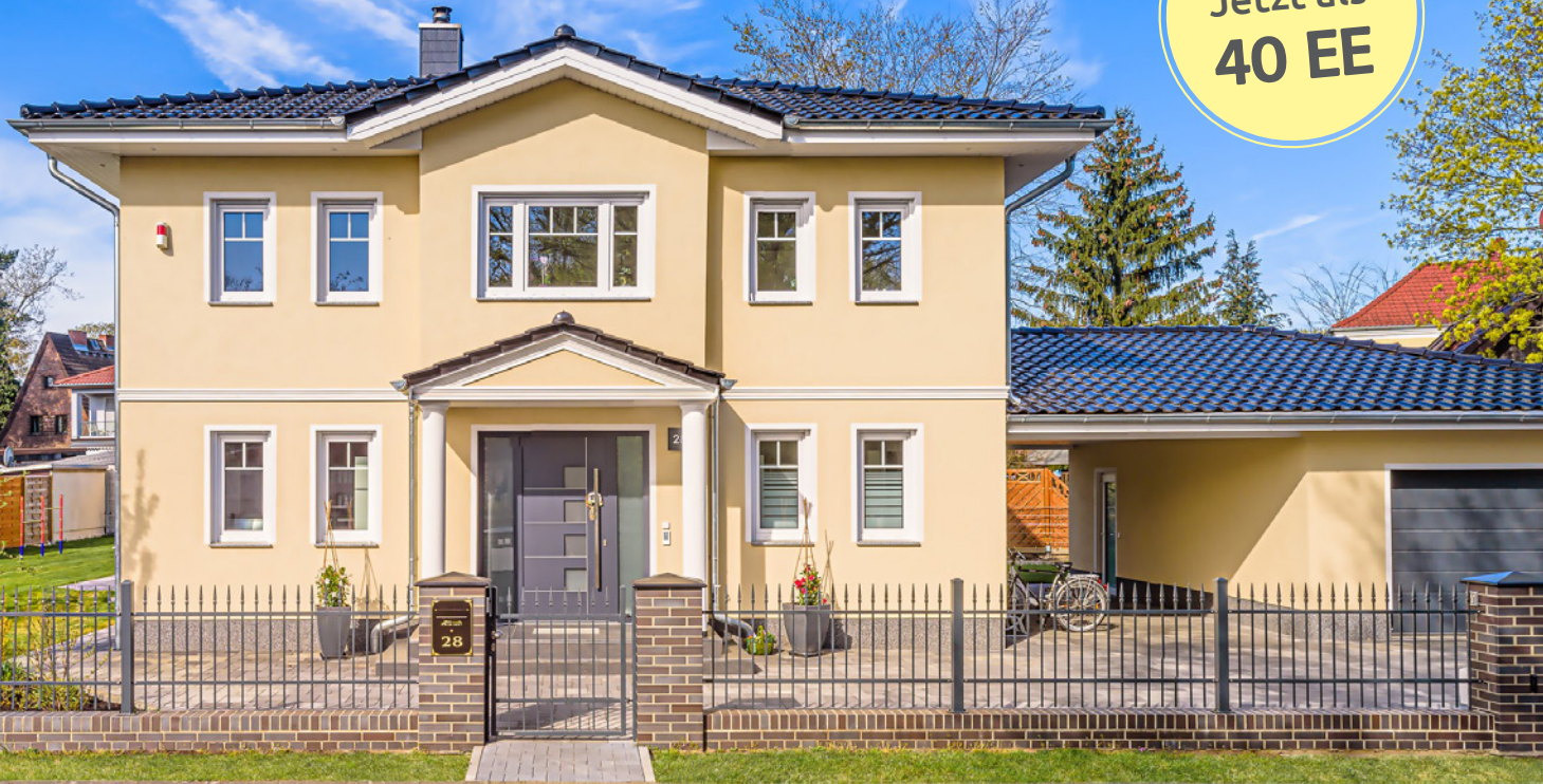
Abbildung enthält Sonderleistungen